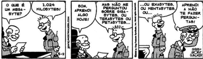
Jornal O Globo. maio 2007.

Se 1.024 megabytes correspondem a 1 gigabyte, quantos kilobytes correspondem a 2 gigabytes?